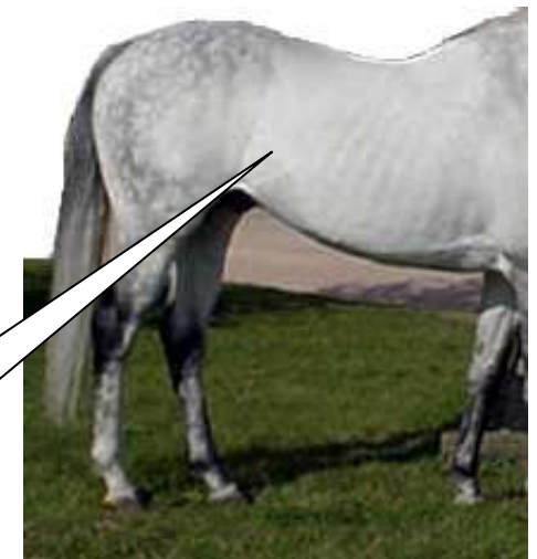
La ligne de pousse

Vous pouvez également mouiller MOTOR DIGEST si vous le souhaitez.