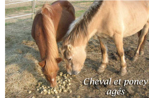
Cheval et poney âgés

Le cheval âgé : à un certain âge, le cheval souffre d'une mauvaise dentition, voir d'une souffrance à chaque coup de mâchoire lorsqu'il mange son foin. NATURAL DIGEST est une solution qui lui permettra de consommer des fibres sans souffrir. Vous pouvez mouiller NATURAL DIGEST si vous le souhaitez.